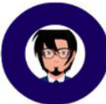
AT SCHWARTZ : 開発/研究