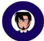
AT SCHWARTZ: РАЗВИТИЕ / ИССЛЕДОВАНИЕ